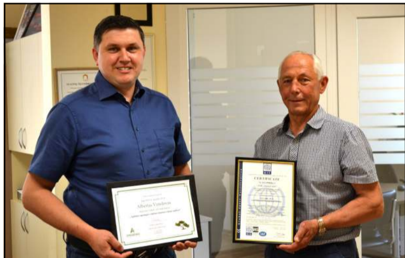
Bendrovės vadovai džiaugiasi gavę sertifiką ir tai vertina kaip bendrą kolektyvo pasiekimą

-Mūsų įmonei šis pasiekimas labai aktualus, nes atsivėrė keliai į visus