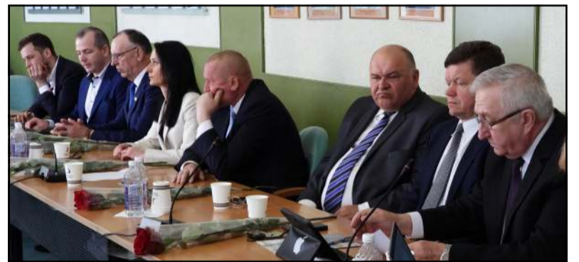
Darbotvarkėje buvo per trisdešimt klausimų, daliai jų, susijusių su turto valdymu, perdavimu ar perėmimu, išspęsti tereikėjo pakelti ranką

Pradėta nuo mero rezervo, kuris, pasikeitus vietos savivaldos įstatymui, radosi vietoje buvusio administracijos direktoriaus rezervo, ir yra aiškiai apibrėžtas bei naudojamas- ekstremalių situacijų ir stichinių nelaimių atvejais. Tuomet priimtas sprendimas rajono savivaldybei imti 1 milijoną eurų paskolą 10 metų, kurios viena dalis - 550 tūkst. eurų - būtų naudojama jau paimtų anksčiau paskolų grąžinimui, o likusioji dalis tektų savivaldybės įgyvendinamiems projektams, pirmiausia - Europos Sąjungos finansuojamiems.