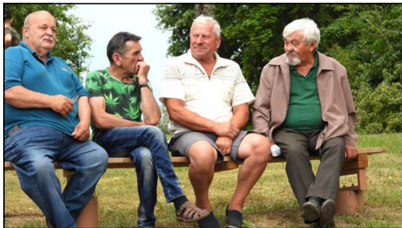
„Šilo“ koncerto besiklausant susibūrė kaimynai ir draugai