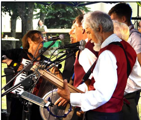
Skambėjo ir pačių kūrybos dainos - „Šilas“

vandens, savo kertės, darbo mielo, širdies šilumos, padangės taikios... Ir, regis, tai videniškiečiai turi, nes