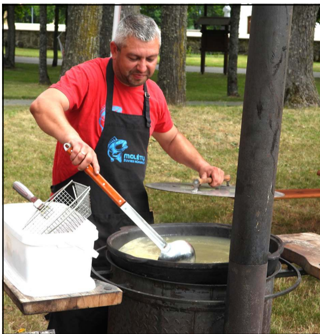
Vaidas sukosi prie rūkyklos ir didžiulio ungurienės puodo