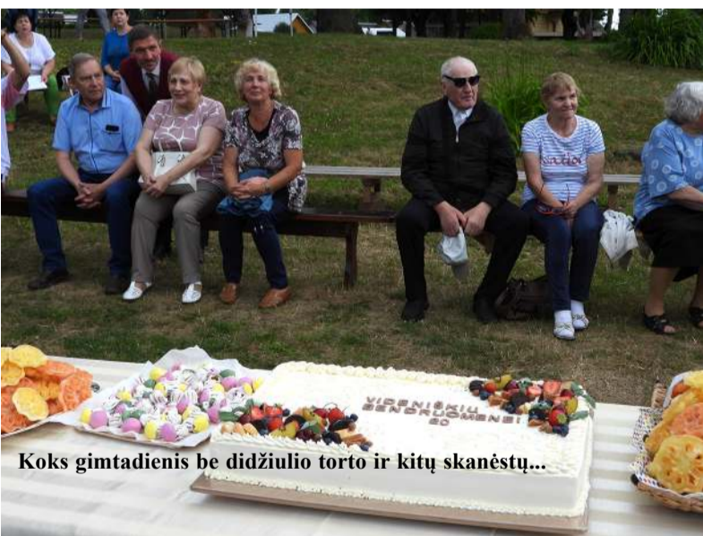
Koks gimtadienis be didžiulio torto ir kitų skanėstų...