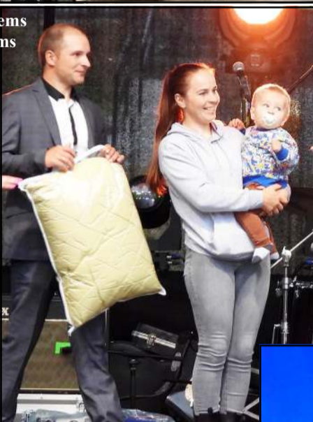
Viktorija džiaugėsi bendra švente