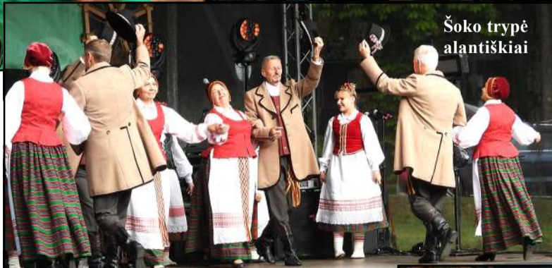
Šoko trypė alantiškiai