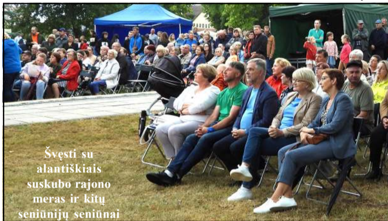
Šventė su alantiškiais suskubo rajono meras ir kitų seniūnijų seniūnai

Aidonas tik džiaugėsi, jog Šeimų šventė išaugo į paauglystę, persivėrė į antrąjį dešimtmetį, ir bus vis gausesnė ir geresnė, puoselėjanti tradicijas, pagerbianti savo krašto žmones, prisikviečianti daug svečių. „Tai ne seniūno šventė, tai tik buvo įgyvendinta mano idėja, kuri bus tęsiama, o šiemet jau pasikvietėme gyvo garso grupę „Biplan“, pakėlėme kartelę, kurią išlaikysime, nes tapome išmanesni, žmonės tapo dosnesni, surasta daugybė rėmėjų, be to, rašėme projektą ir gavome iš VVG finan-