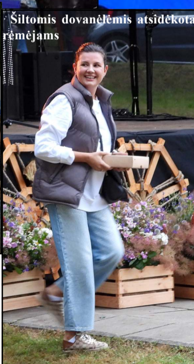
Šiltomis dovanėlėmis atsidedkora rėmėjams