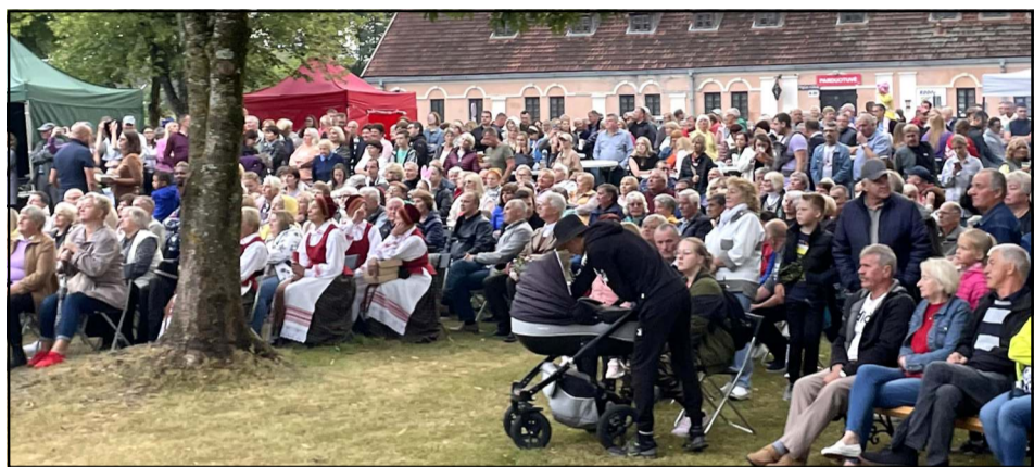
Pirmą kartą tiek lietaus gavusi šventė sulaukė ypač didelio jos dalyvių skaičiaus