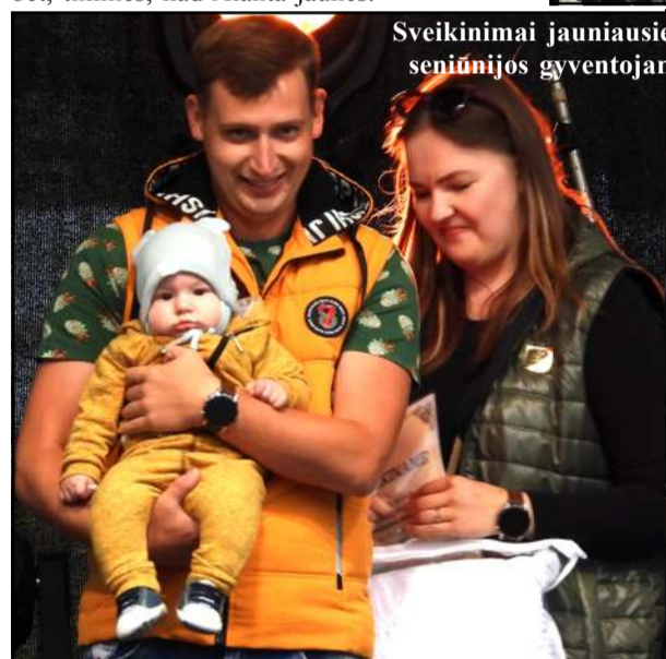
Sveikinimai jauniausiems seniūnijos gyventojams