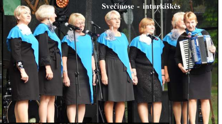
Svečiuose - inturkiškės