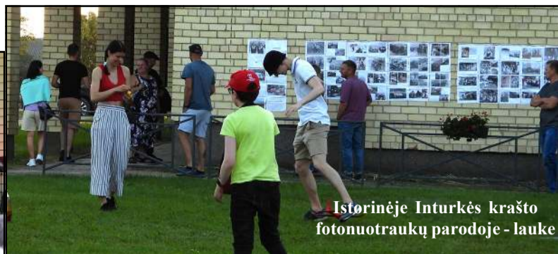
Istorinėje Inturkės krašto fotonuotraukų parodoje - lauke