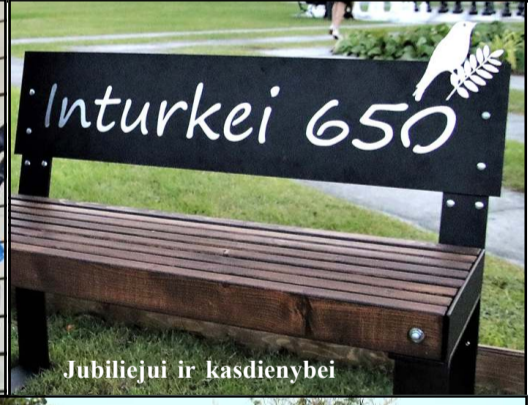
Jubiliejui ir kasdienybei