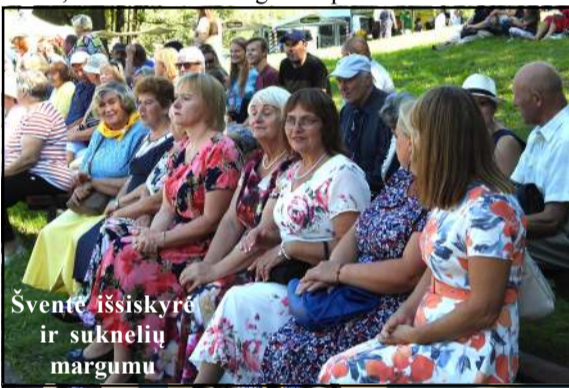
Šventė išsiskyrė ir suknelių margumu