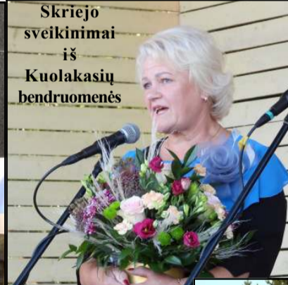
Skriejo sveikinimai iš Kuolakasių bendruomenės