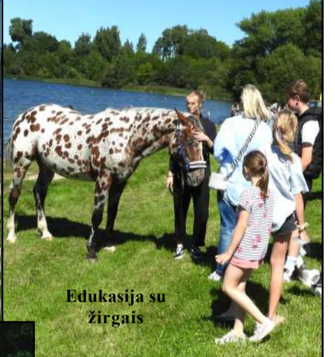
Edukacija su žirgais