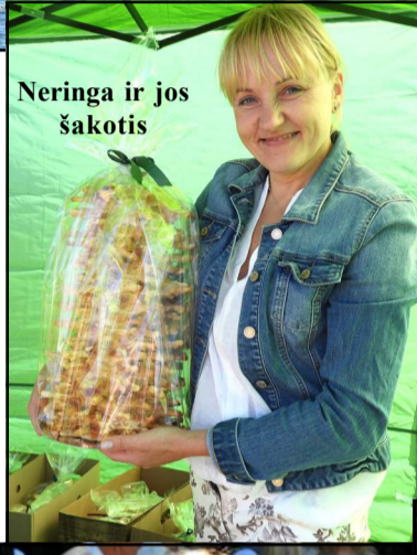
Neringa ir jos šakotis

džiaugėsi sutikęs..." "Balninkų miestelis visada apibūdamas kaip puikus, gražus, nuostabus. Prie Balninkų traukia skirtingos jėgos - kultūrinė, pažintinė, istorinė, pramoginė. Balninkai tai ne tik