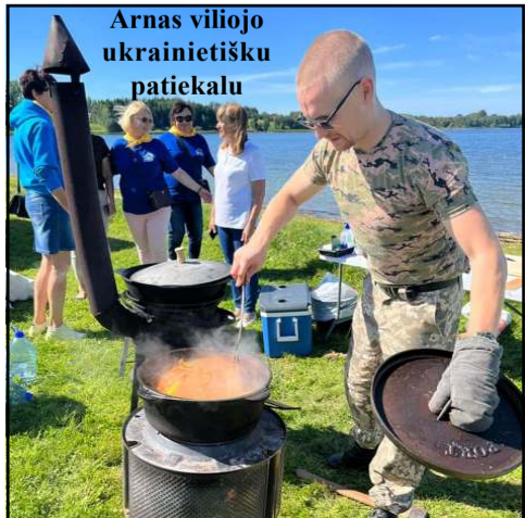
Arnas viliojo ukrainietišku patiekalu

Sveikinu su jubiliejumi, dėkoju, kad kuriate šią vietą, ją puoselėjate," -