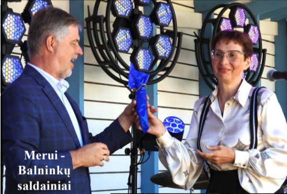
Merui - Balninkų saldainiai