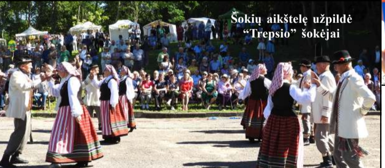
Šokių aikštelę užpildė "Trepzio" šokėjai

niškiai, o ketvirtą vietą, tik 5 sekundėmis atsilikę, užėmė "Balninkų vilkai"... Iš Alaušų ežero paplūdimio dalyviams ir prekybininkams persikėlus į koncertinę aikštelę, viena iš pagrindinių šven-