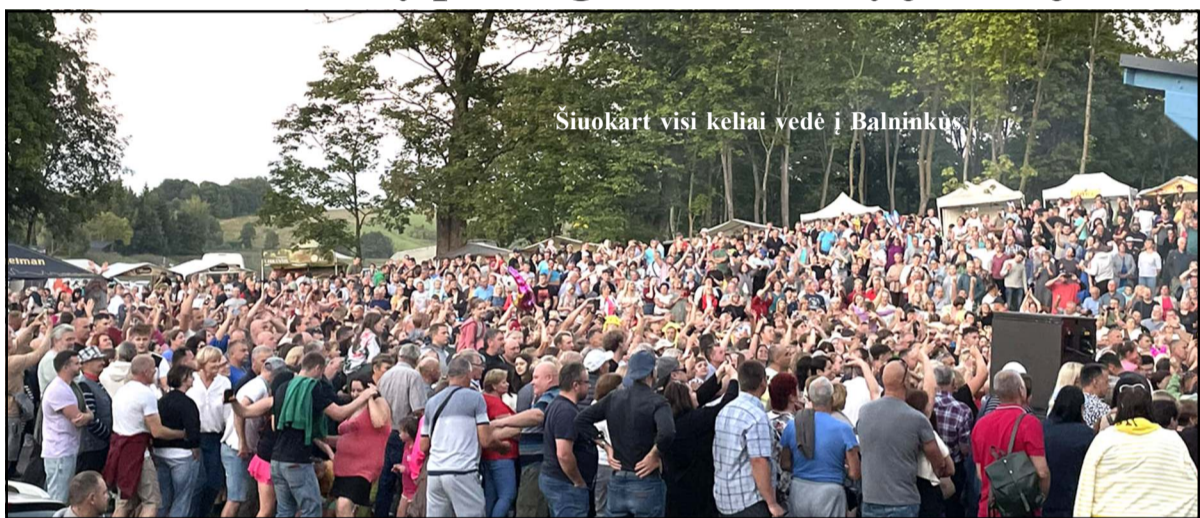
Suokart visi keliai vedė į Balninkus