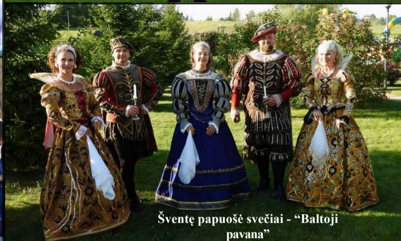
Šventę papuošė svečiai - "Baltoji pavana"