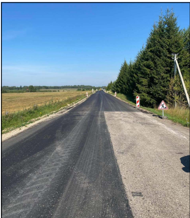
Kelias jau po prevencijos...

LAKD informuoja, kad šiuo metu Molėtų rajone yra vykdomi rajoni-