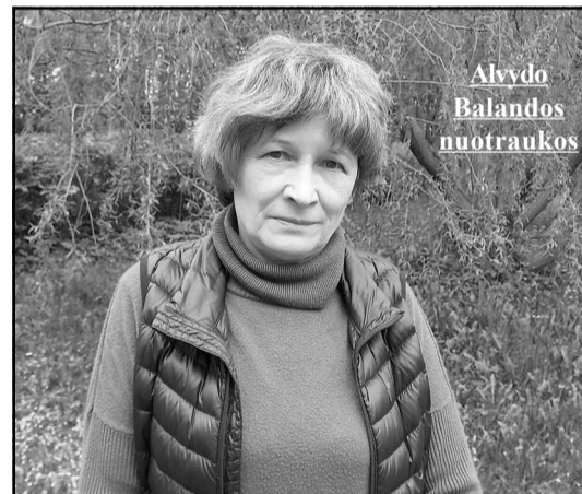
Alyvdo Balandos nuotraukos