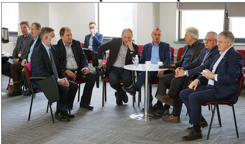
2022 - ūjų kovo pabaigoje Molėtų viešosios bibliotekos konferencijų salėje mūsų ir Utenos savivaldybių vadovai bei verslininkai susitikime su Susisiekimo ministru bei Automobilių kelių direkcijos tuometiniu vadovu buvo patikinti, jog betonkelis keisis greitai ir pagal grafiką, nors ir kritikuotas 2+1 vienas kelio juostų variantas

Šiuo metu jau yra rekonstruota šio kelio dalis nuo Vilniaus iki 21,5 km, o kelio pertvarkymas nuo 21,5 km iki pat Utenos miesto, arba daugiau