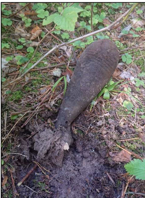
Pirmadienį grybautojas miške Čiulėnų s. rado II pasaulinio karo laikų 82 mm minosvaidžio sviedinį, kurį atvykę išminuotojai sunaikino vietoje

kita nebepajėgė atlikti girtumo patikros, turbūt sukonfliktavo, nes pareigūnai buvo kviesti dėl to, kad draugė draugei ranką peiliu supjaustė. Atvykus pareigūnams, girtutėlė pranešėja tebetvirtino buvusi sugėrovės peiliu užpulta, bet... pareiškimo nerašė ir dar tvirtino, kad jokių pretenzijų draugei neturinti! O Joniškių s. kivrčas tarp sugyventinių išspręstas neblaiviam (3, 28 prom.) vyrui paskyrus orderį. Mat blaivi jo sugyventinė nenorėjo neblaivaus vyro įsileisti į namus. Tarp girtaujančių ir besikivirčijančių sutuoktinių Mindūnų s. eilinį kartą kilus barniui, pareigūnus kvietė moteris (3, 37 prom.), kuri skundėsi už ją šiek tiek blaivesnio sutuoktinio (3, 20 prom.) elgesiu ir konfliktu, kuris kilo dėl alkoholinių gėrimų nepasidalinimo. Vyrui įteiktas orderis... Blaivi molėtiškė kategoriškai atsakė į namus įsileisti neblaivų sutuoktinį. Moteris sa-