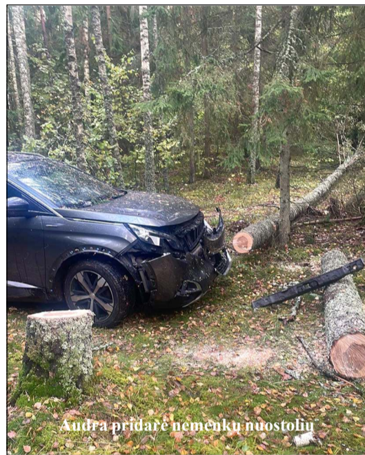
Audra pridare nemėnkų nuostolius

gių s., jos savininkas pranešė policijos pareigūnams, o pastarieji apžiūrėję sodybą įsilaužimo pėdsakų nepastebėjo, nes greičiausiai buvo atliekama elektros skaitiklio patikra. Taipogi iš Dubingių s. buvo gautas pranešimas apie nelegaliai kertamą mišką, tačiau patikrinus informaciją nustatyta, kad miškas kertamas le-