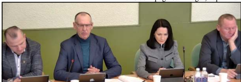
Opozicija atvirai abejojo ligoninės audito reikalingumu ir savalaikiškumu

mas, o reikėjo funkcinės – struktūrinės analizės, kokios bus paslaugos, kokie darbuotojai, viskas būtų aišku, žaidžiame žaidimus, neva, auditas parodys reikalingus sprendimus... Pradėkim nuo pradžios – struktūra, etatai, kiek visko reikės, kokie įkainiai, kaip finansuojami ir pan.“