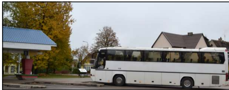
Kitų miestų autobusų parkai tolimojo susisiekimo maršrutams jau parenka didesnius autobusus