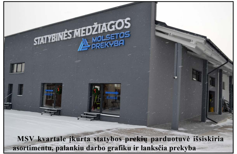
MSV kvartale įkurta statybos prekių parduotuvė išsiskiria asortimentu, palankiu darbo grafiku ir lanksčia prekyba

pasitikėjimo, gal būta baimių, juk kai esi samdomas, yra garantijos dėl darbo atlygio, galų gale - paties darbo... Galiu pajuokauti, kad statybinės įmonės griūtis pažadino verslininką. Laimei, daug žmonių, su kuriais buvau dirbęs, liko, atėjo pas mane, pasitikėjo. Nesigailiu dėl nieko. Nors pirkau iš bankroto administratoriaus visą teritoriją, dėl ko teko daug reikalų turėti su bankais. Molėtai atsigauna, nekilnojamas turtas brangsta, tad būsiu lyg loterijoje lai-