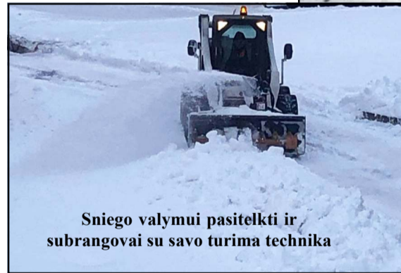
Sniego valymui pasitelkti ir subrangovai su savo turima technika

tikrai nebus nuvalyti, ypač tada kai sniega ir pusto... Tiesa, yra ir besistebeinčių, kad kaimuose keliai geriau nuvalyti negu Vilniuje..."