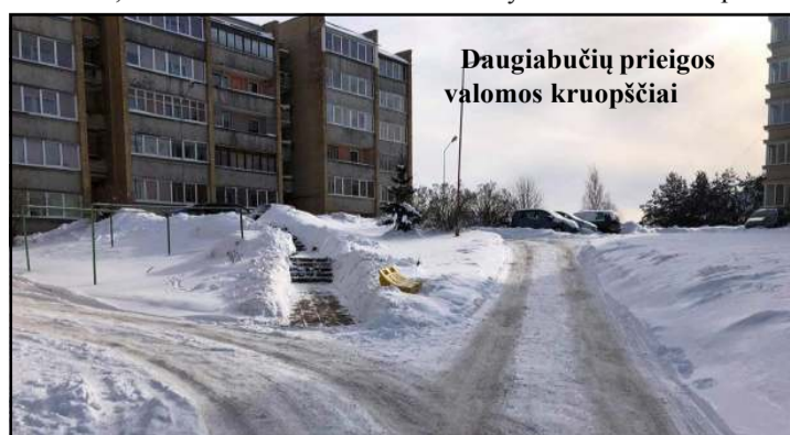
Daugiabučių prieigos valomos kruopščiai