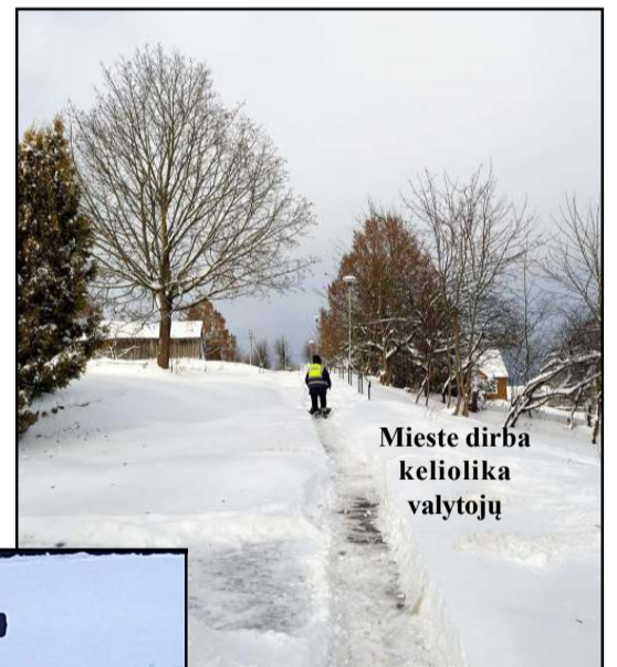
Mieste dirba keliolika valytojų