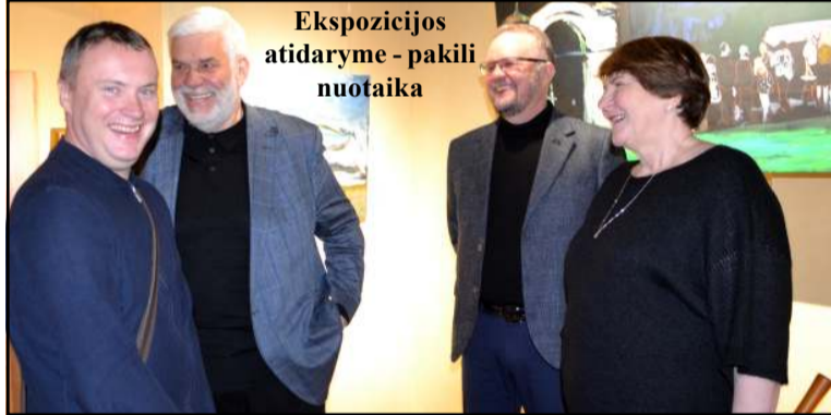
Ekspozicijos atidaryme - pakili nuotaika