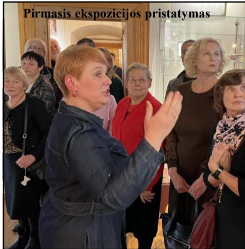
Pirmasis ekspozicijos pristatymas