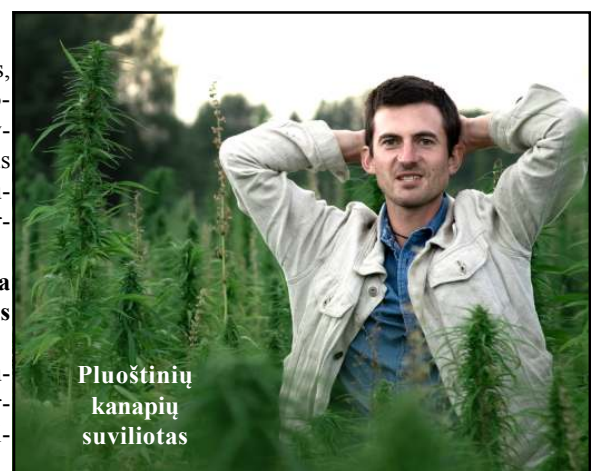
Pluoštinių kanapių suviliotas

- Ji yra, dviprasmybės nepaslepšime. Mes Šironijoje auginame pluoštines kanapes ir užaugintą produktą perdirbame. Tam sukurtos bendradarbiavimo grandinės - tiekimo, perdirbimo. Viskas ūkyje di- (Nukelta į 4 psl.)