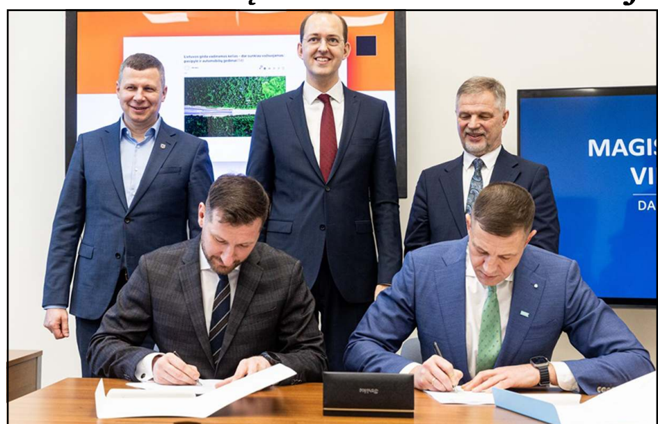
Oficiali žinia paskelbta dalyvaujant Susisiekimo ministru, Lietuvos automobilių kelių direkcijos atstovams bei Utenos ir Molėtų rajonų merams

"Nuo dešimtmečius girdėtų kalbų ir dalytų pažadų pereiname prie (Nukelta į 3 psl.)