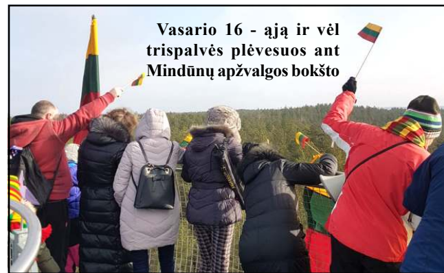
Vasario 16 - ają ir vėl trispalvės plėvesuos ant Mindūnų apžvalgos bokšto

Trumpiausias šių metų mėnuo vasaris vos sutalpina renginių gausą - mėnesiui įpusėjus išpūdingą Viktorijos Bitės raugo keramikos parodą