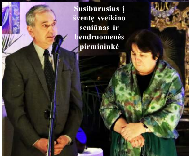
Susibūrusius į šventę sveikino seniūnas ir bendruomenės pirmininkė