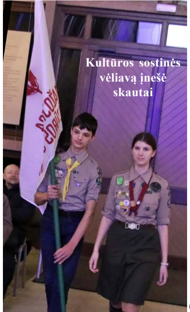
Kultūros sostinės vėliavą įnešė skautai

Dubingių bažnyčioje Vasario 16-osios išvakarėse būta ypatingo kultūrinio įvykio - mat čia įvyko Mažosios kultūros sostinės atida-