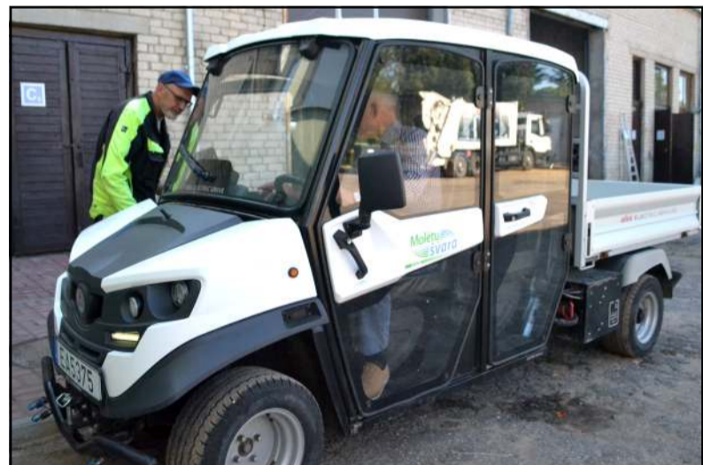
Bendrovės įsigytas elektromobilis liudija apie besiformuojantį požiūrį į ekologiją ir tvarumą

Tęsiant daugiabučių namų administravimo temą ir palietus žiemišką