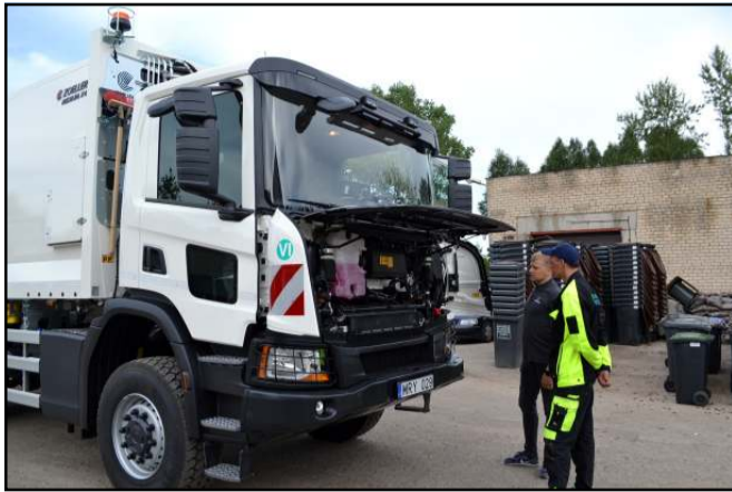
Praėjusių metų pirkiny - nauja šiukšliavėžė, gerokai patuštinti bendrovės finansus, bet atliekų surinkimo paslauga be šios investicijos nebūtų sėkminga ir šiuolaikiška

Nors bendrovės papildomų darbų pajamos išaugo apie 50 tūkst. eurų,