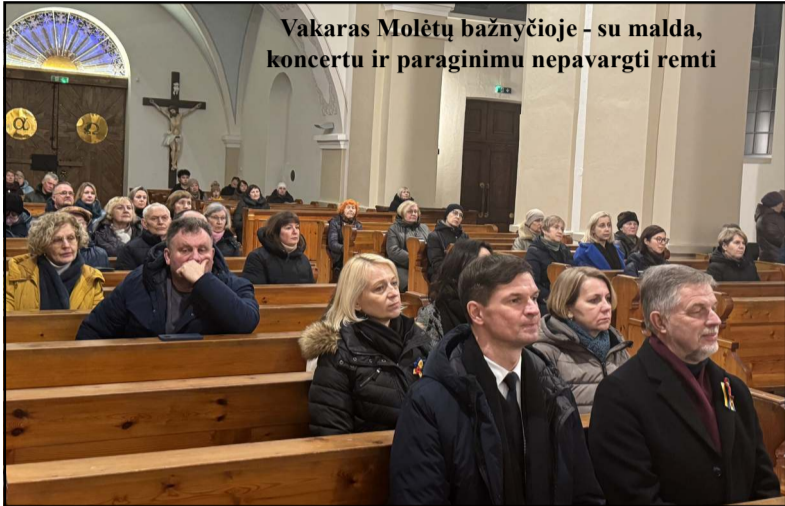
Vakaras Molėtų bažnyčioje - su malda, koncertu ir paraginiu nepavargti remti