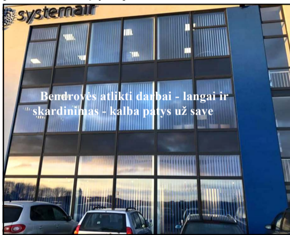
Bendrovės atlikti darbai - langai ir skardinimas - kalba patys už save