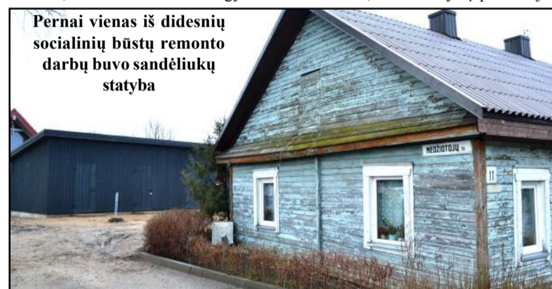
Pernai vienas iš didesnių socialinių būstų remonto darbų buvo sandėliukų statyba

asmeninių priežasčių. Rajono meras ir administracijos direktorius jai padėkojo už atliktus darbus bei palinkėjo sėkmės ateityje.