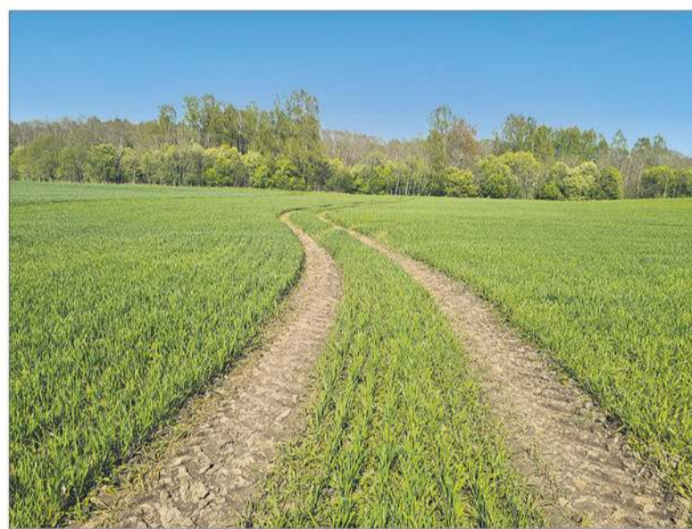
Vienas svarbiausių išmokų skyrimo tikslų – didesnis ūkininkų dėmesys aplinkosaugai.

Pagal atnaujintas taisykles sumažinta aktyviam ūkininkui taikoma leistina riba, pagal kurią ūkio subjektai, kurie už praėjusius metus gavo ne daugiau kaip 2000 Eur (buvo 5000 Eur) tiesioginių išmokų, automatiškai laikomi aktyviais ūkininkais, t. y. nevertinant jų atitikties „aktyvaus ūkininko“ kriterijams.