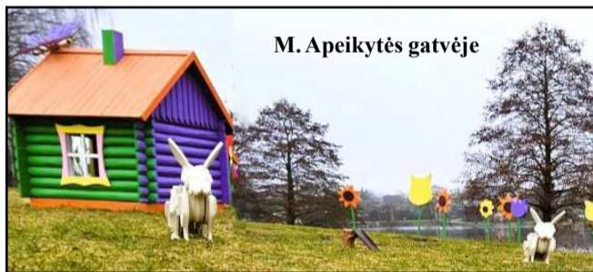
M. Apeikytės gatvėje

Jau prieš kurį laiką kai kurios miesto erdvės tapo mažomis artėjančios pavasario šventės - šv. Velykų oazėmis. Jaunimo aikštėje radosi margučių - ir ant žemės, ir medžiuose, o M. Apeikytės gatvėje įsikūrė tikras Zuikių slėnis su mažųjų molėtiškių pamėgtu nameliu ir smagiais pievoje striksinčiais zuikiais, pražydusiomis rankų darbo gelėmis ir įvairiaspalviais margučiais. Jaunimo aikštės dekoracijomis, kaip jau tapo įprasta prisidėjo Trečiojo amžiaus universiteto bendruomenė, draugiškai nęrusi, mezgusi ir vėlusiu margučius, o kitomis