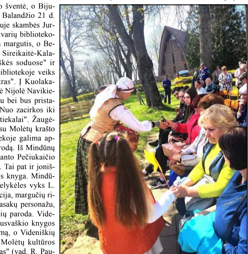
Šiemet Dubingiuose Jurginės bus švenčiamos balandžio 21 dieną

SENIŪNĖ. Įvyko konkursas į Molėtų rajono Luokesos seniūnijos seniūno pareigas. Konkurso laimėto