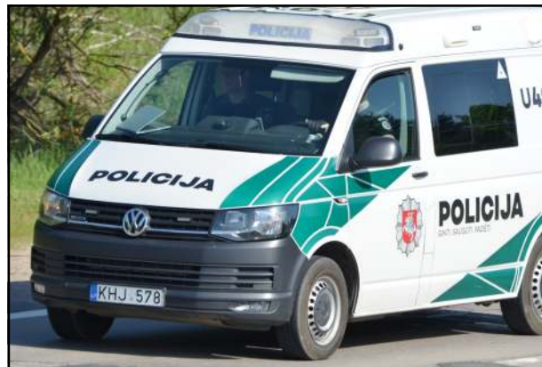
Pareigūnams tenka reaguoti ir į kurioziškus iškvietimus

jės kaimynas nepageidaujamu tapo pasibaigus svaigalams. O namuose Luokesos s. pasiteisino patarlė, kad kai du pešai, trečias laimi... Nors laimėjimu ir nepavadinasi, bet trečio asmens vis tik būta. Mat susimusus dviem vyrams bei atvykus pareigūnams, sugyventinį dar užsi puolė ir jo draugė. Moteriškai, kuriai nustatytas 3, 10 prom. girtumas, buvo skirtas orderis, o kadangi ji dar ir pareigūnus išplūdo, tai užsidirbo ir protokolą už pareigūnų garbės ir orumo įžeidimą.