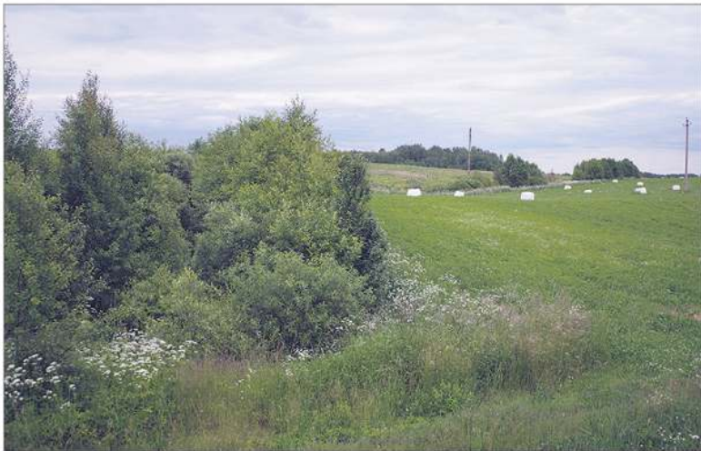
Daugiametės pievas būtina saugoti ir jų nearti, kad ateityje vėl netektų susidurti su šių pievų išlaikymo problema.

Europos Parlamentas (EP) patvirtino reglamento, susijusio su daugiamečių pievų išlaikymo nuostatomis, pakeitimus, todėl pasėlius deklaravusiems Lietuvos ūkininkams daugiamečių pievų šiais metais atkurti nereikės. Dar iki Europos Komisijos (EK) priimto teisės akto Žemės ūkio ministerija buvo informavusi ūkininkus apie numatomą palankų sprendimą, kad jie laiku galėtų pradėti pavasarinis darbus.