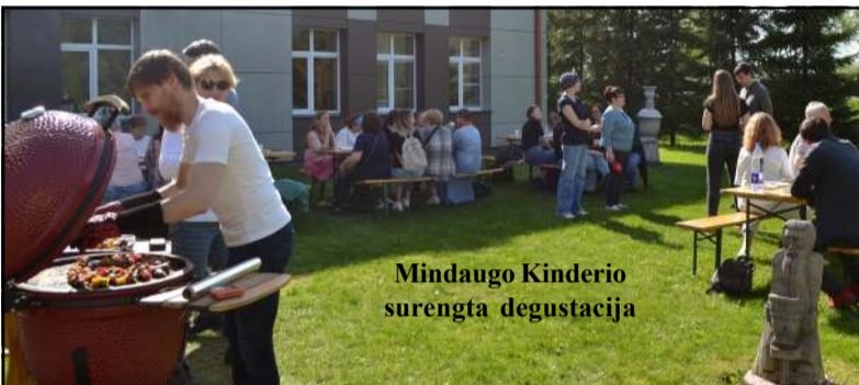
Mindaugo Kinderio surengta degustacija

jai" dėka Utenos kolegijos Medicinos fakulteto pastato sieną irgi puošia uteniškės Lietuvos raganos Eu-