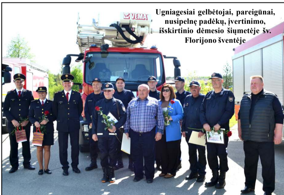
Ugniagesiai gelbėtojai, pareigūnai, nusipelnę padėkų, įvertinimo, išskirtinio dėmesio šiųmetėje šv. Florijono šventėje

Priešgaisrinės apsaugos ir gelbėjimo departamento (PAGD) Panevėžio priešgaisrinės gelbėjimo valdy-