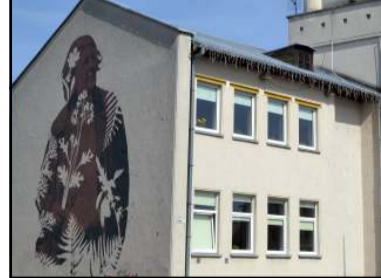
Utenos miesto pastatai puošiami kraštiečių portretais

kas Tomas vaišino kibiniais ir išskirtiniu gaminiu kardamoninėmis bandelėmis, kurias valgant mėgautasi "Vanilinio dangaus" kava ir arbata. Dauniškio parke pasitiko Utenos žir-