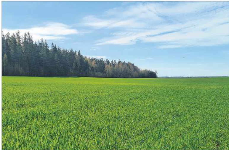
Apie pasėlių deklaravimo naujoves ūkininkai informuojami įvairiomis priemonėmis.

Kitas žinotinas dalykas – tikslinami bendrieji šienavimo reikalavimai tiesioginėms išmokoms gauti. Kai ekologinių sistemų ar kaimo plėtros intervencinių priemonių reikalavimuose nenustatyta kitaip, ūkininkai pievas ir ganyklas, žolinių augalų plotus privalo bent 1 kartą iki einamųjų metų rugsėjo 1