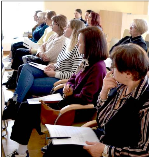
Atvirų durų dienos metu paslaugos pristatytos visiems partneriams, kad būtų apie jas sklaidžiama geroji žinia