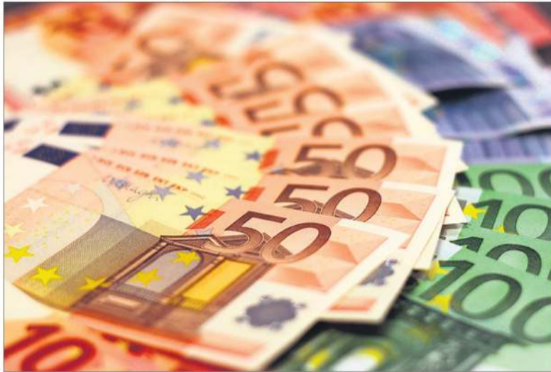
Vis daugiau ūkininkų susidomi priemone „Tvarios investicijos į žemės ūkio valdas“, nes teikiama parama padeda stabilizuoti ūkio ekonominę padėtį.

kai gali gauti dotaciją, lengvatinę paskolą arba dotaciją kartu su lengvatine paskola. „Jau įvyko 2 kvietimai. Per juos buvo surinkta paraiškų, kuriomis prašoma 39,8 mln. eurų paramos dotacijos forma. Šiuo metu per abu kvietimus jau yra pasirašytos sutartys 39 projektams įgyvendinti, iš viso jiems skirta 14,6 mln. eurų, – priemonę apžvelgia patarėja. – Šiuo metu priimamos paraiškos tik lengvatinei paskolai gauti. Kitais metais vėl bus skelbiamas kvietimas ir dotacijoms.“