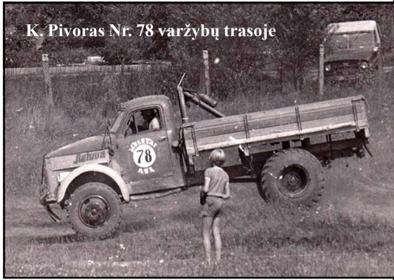
K. Pivoras Nr. 78 varžybų trasoje

Praėjusio mažiau aštuntajame dešimtmetyje dauguma Lietuvos autotransporto įmonių (ATĮ) jau turėjo entuziastų, dalyvaujančių sunkvežimių autokroso varžybose. Tikrovėje prasidėjusi nuo entuziastų, lakančių su sunkvežimiais po laukus, ši techninio sporto šaka vėliau tapo varžybomis tarp Lietuvos įmonių, turėjusių didelius sunkvežimių parkus. Tokiam sportui neprieštaravo ir transporto ministerija. Tuo labiau