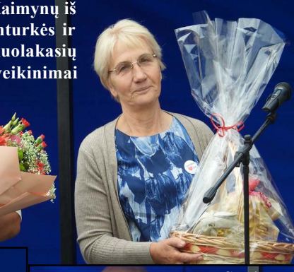
Kaimynų iš Inturkės ir Kuolakasių sveikinimai

bradės fanfarinis orkestras, sukviėtės visus dar užsilikusius namuose į sambūrį, kuriame pasida-