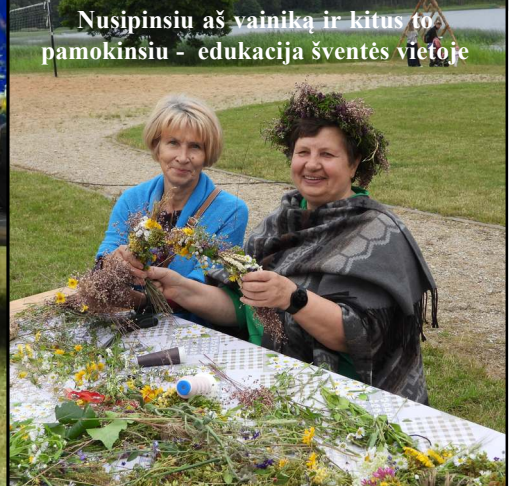
Nušipinsiu aš vainiką ir kitus to pamokinsiu - edukacija šventės vietoje