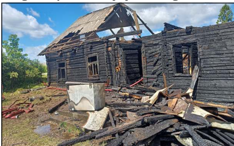
Tai jau antras gaisras šiame name...