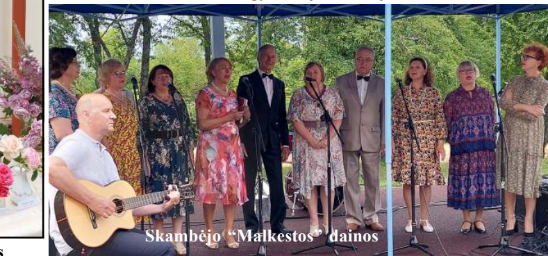
Skambėjo "Malkestos" dainos