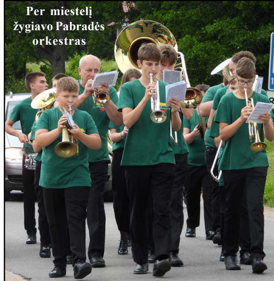
Per miestelį žygiavo Pabradės orkestras

bradės fanfarinis orkestras, sukviėtės visus dar užsilikusius namuose į sambūrį, kuriame pasida-