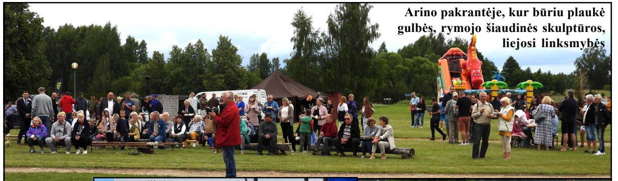
Arino pakrantėje, kur būriu plaukė gūbės, rymojo šiaudinės skulptūros, liejosi linksmybės