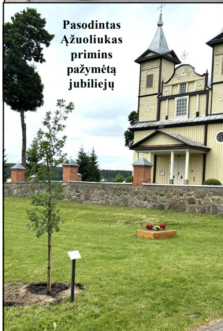
Pasodintas ąžuoliukas primins pažymėtą jubiliejų