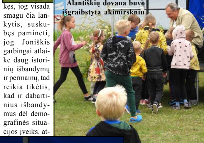
Alantiškių dovana buvo išgraibstyta akimirksniu