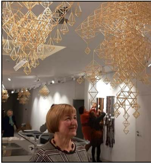
Abu sodai - Zitos Spranginienės, vienas iš jų šiuo metu iškeliavęs į respublikinę parodą

Į Lietuvos dainų šventės Liaudies dailės parodą darbai buvo atrinkami iš apskričių regionų konkursinių liaudies meno parodų "Aukso vainikas". Parodoje eksponuojamos įvairios liaudies dailės rūšys: vaizduojamoji, taikomoji ir paprotinė. Didelė garbė, kad į parodą "Iš šerdies" atrinkta ir Molėtų rajono tautodailininkų sodų ryšėj