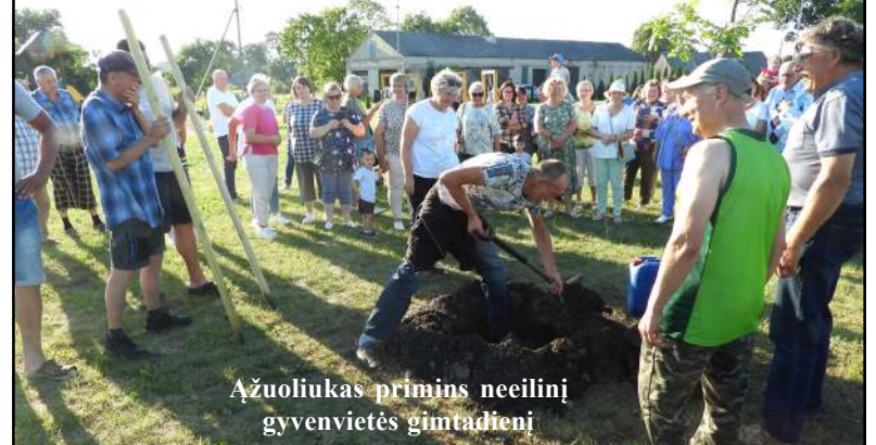
Ažuoliukas primins neeilinį gyvenvietės gimtadienį

Įtarus AKM būtina nedelsiant kreiptis į veterinarijos gydytoją ir pranešti apie įtarimą VMVT numeriais 1879 arba +370 5 242 0108. Pranešti taip pat galima ir info@vmvt.lt