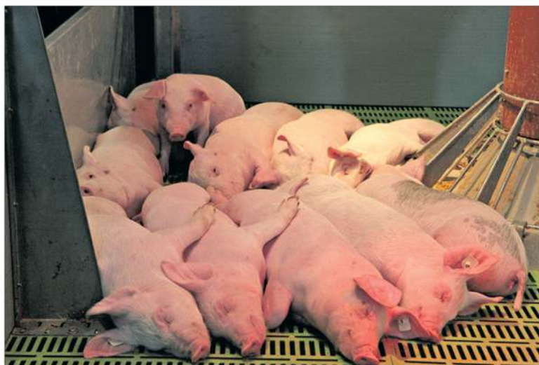
Savo gyvūnais reikia rūpintis atsakingai, kad AKM virusas neplistų toliau.

Daugėja afrikinio kiaulių maru (AKM) užsikrėtusių kiaulių ūkių. Trečiadienį patvirtintas jau trečias viruso židinytis Lietuvoje, šįsyk – penkias kiaules laikusiam ūkyje Klaipėdos rajone, Priekulės seniūnijoje. Valstybinės maisto ir veterinarijos tarnybos (VMVT) specialistai nustatė apsaugos ir priežiūros zonas, sudarė epizootinio tyrimo grupę, siekdama nustatyti ligos ir kiaulių laikymo vietą patekimo kelius. Dėl minėtų protrūkių ir ribojimų zonas pateko ir 4 stambūs kiaulininkystės ūkiai, kurie patirs nuostolių dėl prekybinių ribojimų.