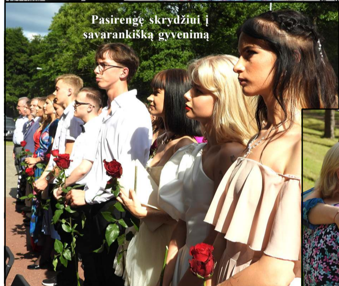
Pasirenę skrydžiui į savarankišką gyvenimą