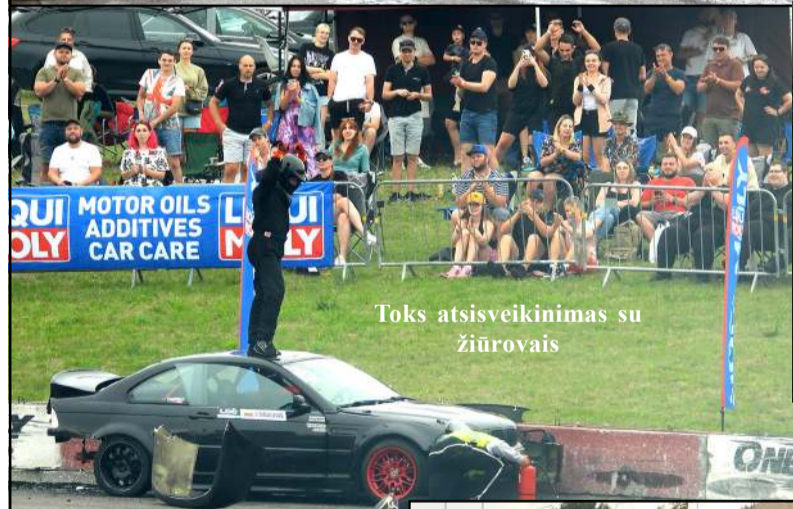
Toks atsisveikinimas su žiūrovais