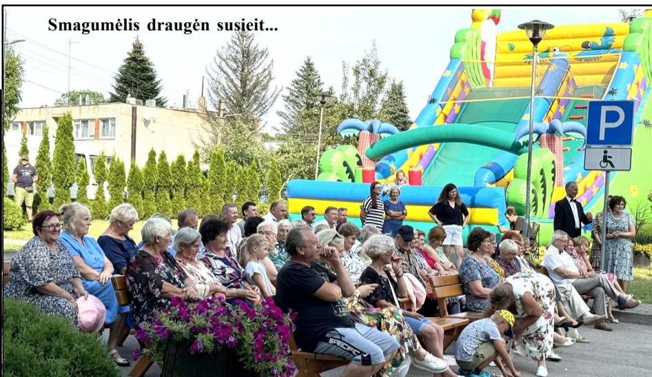
Smagumėlis draugėn susieit...