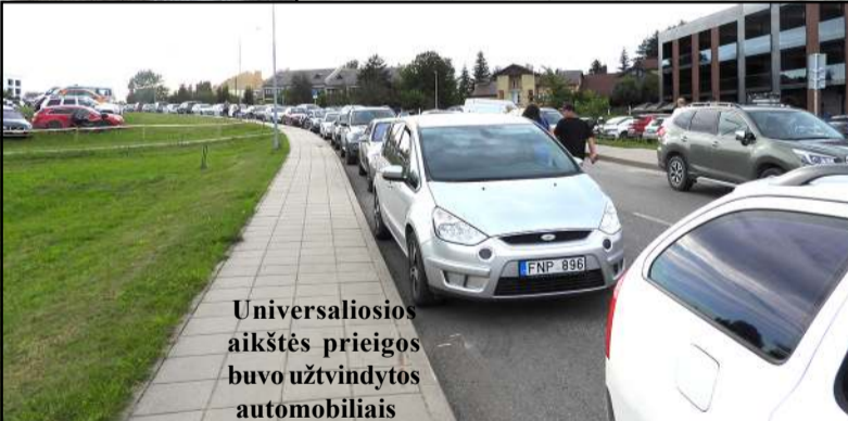
Universalios aikštės prieigos buvo užtvindytos automobiliais