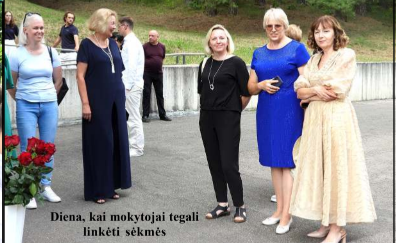
Diena, kai mokytojai tegali linkėti sėkmės