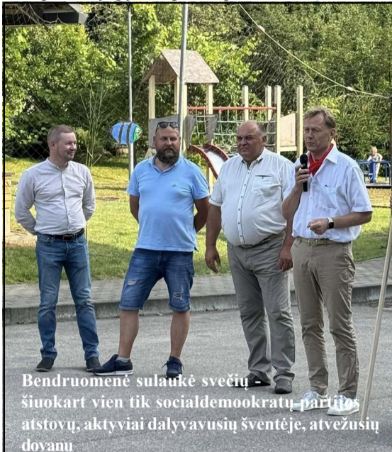
Bendruomenė sulaukė svečių – šiuokart vien tik socialdemokratų partijos atstovų, aktyviai dalyvavusių šventėje, atvežusių dovanų