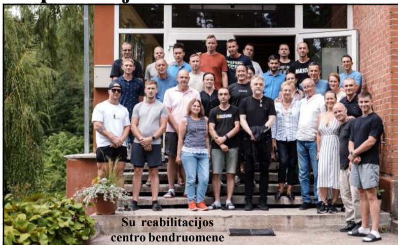
Su reabilitacijos centro bendruomene

Praėjusį šeštadienį Vasaros estradoje įvyko vienas iš Andriaus Mamontovo šią vasarą rengiamo Lietuvoje turo "Vienas. Vasara" koncertų, į kurį susirinkę žiūrovai, jo sukurtos grupės „Fojė“ fanai užpildė visą erdvę. Tiesa, koncertas buvo mokamas, todėl visi, galbūt besitiekę patekti į šią erdvę be bilieto, turėjo nusivilti. Atlikėjas, savo koncertą Molėtuose gražiausioje koncertinėje erdvėje nusprendė surengti po atviru dangumi, kuris šiuokart iš pradžių nebuvo palankus muzikiniam sambūriui. Prieš