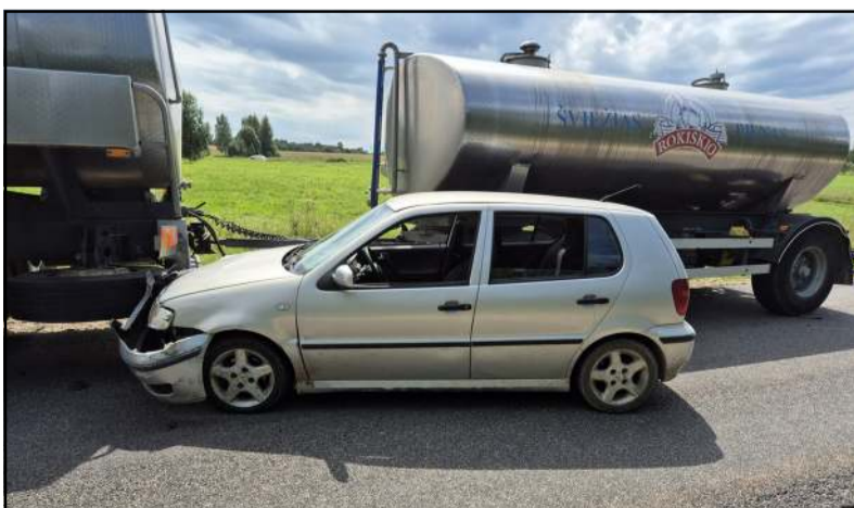
Neblaivaus vairuotojo virazai kelyje baigėsi įsirėžus į pienovežį

Nuo pranešimų apie triukšmą prasidėjusi vidurvasario savaitė policijos pareigūnams buvo nelengva. Reaguota į 93 pranešimus, skirta keliolika orderių, pradėta iki dešimties ikiteisminių tyrimų, fiksuoti eismo įvykiai, skubėta į pagalbą paklydusiems miškuose... Policijos pareigūnams pirmiesiems tenka reaguoti ir į pranešimus apie žmones, turinčius suicidinių minčių, pagelbėti medikams suteikiant pagalbą žmonėms, kuriems sutriko psichika... Į suvestines