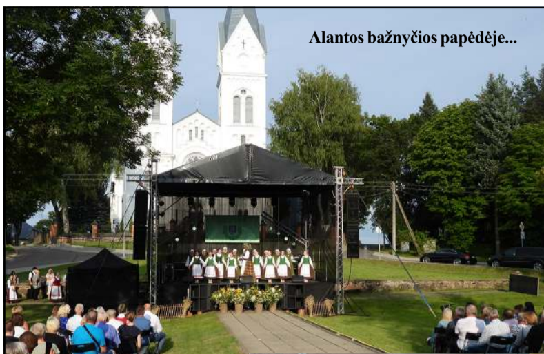
Alantos bažnyčios papėdėje...