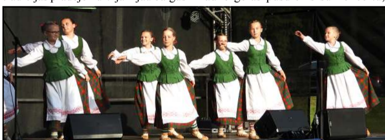
Įstabaus grožio pasirodymai