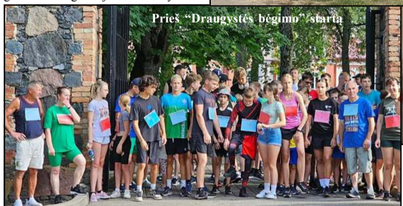
Prieš „Draugystės bėgimo“ startą