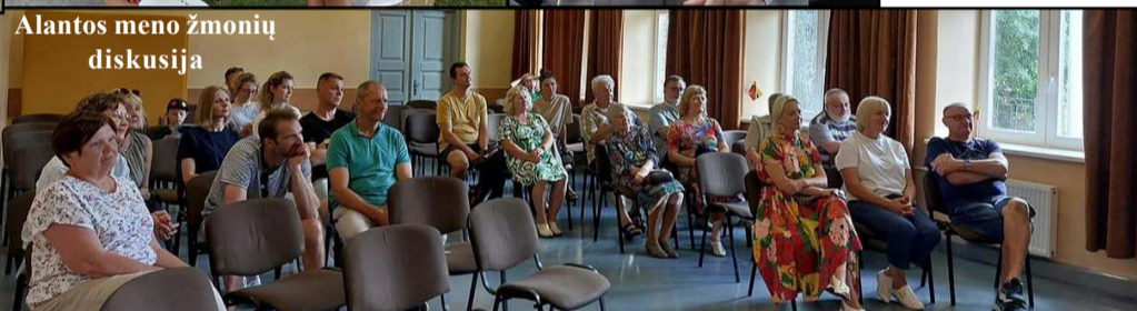
Alantos meno žmonių diskusija

bei paminėjęs, jog ji – pirmoji Alantoje seniūnė moteris. – Labai smagi šventė, gražu, kai žmonės buriasi džiaugtis, būti kartu.“ Šurmulyje sutikta