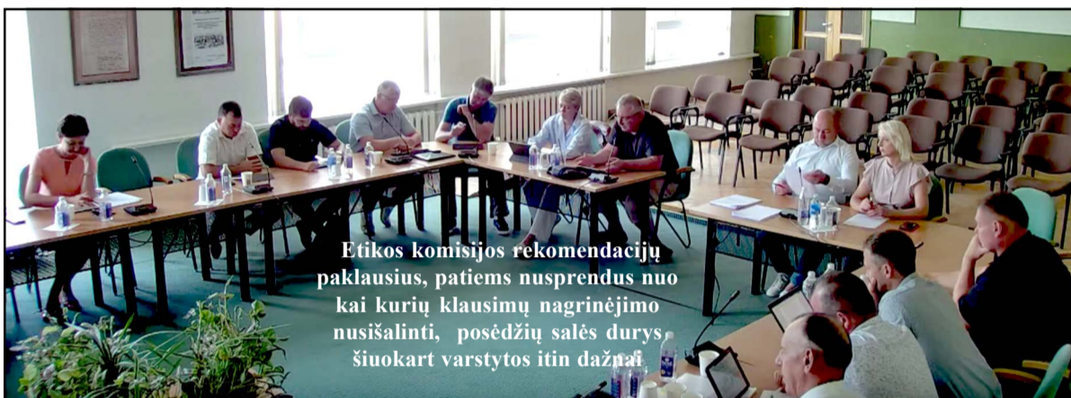
Etikos komisijos rekomendacijų paklausius, patiems nusprendus nuo kai kurių klausimų nagrinėjimo nusišalinti, posėdžių salės durys, šiuokart varstytos itin dažnai

Tuomet imtasi itin svarbaus darbotvarkės klausimo - 2025m. - 2031m. strateginio veiklos plėtros tvirtinimo. To prisireikė pasikeitus