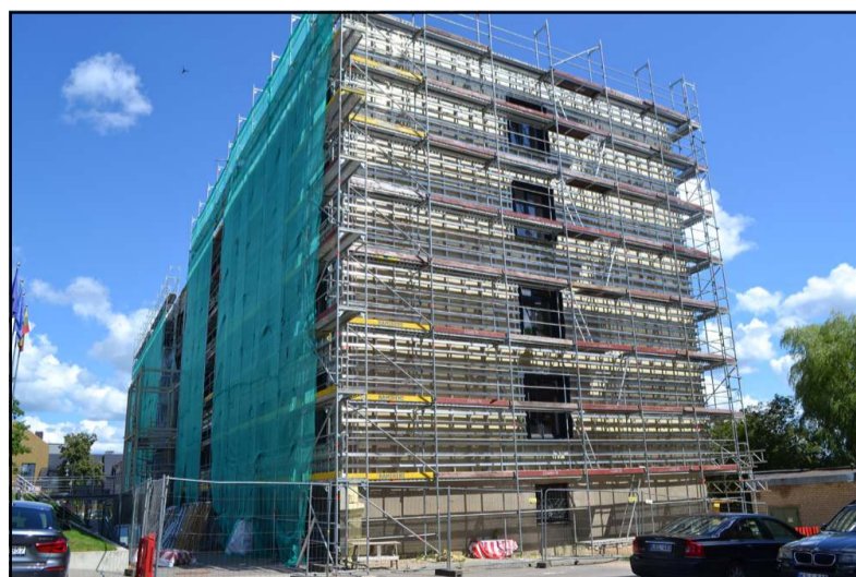
Galų gale savo eilės renovacijos procese sulaukė ir savivaldybės pastatas