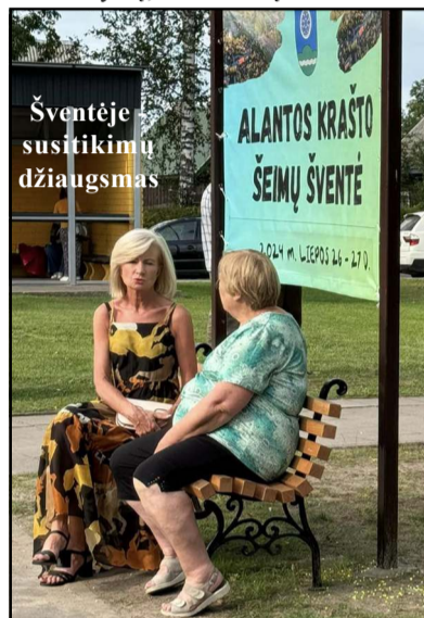
Šventėje susitikimų džiaugsmas