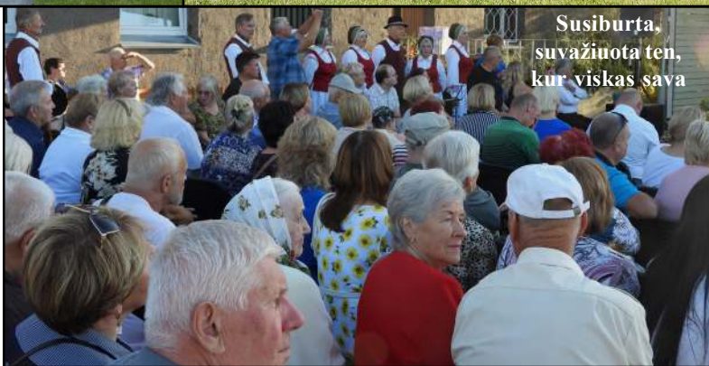
Susiburta, suvažiuota ten, kur viskas sava