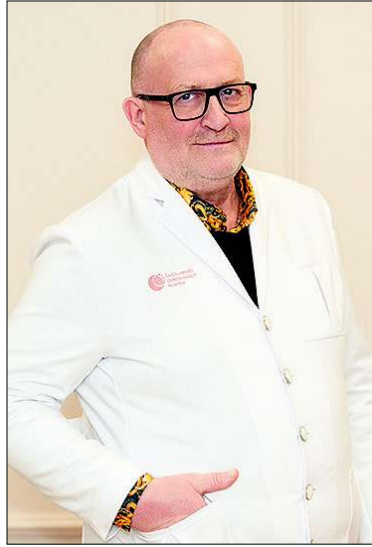
L. Kačinsko teigimu, pacientai neretai slepia savo diagnozę nuo namiškių, nes bijo diagnozę pripažinti patys sau.

Nuo kasdienybės jaučiamos įtampos gali pakilti kraujospūdis,