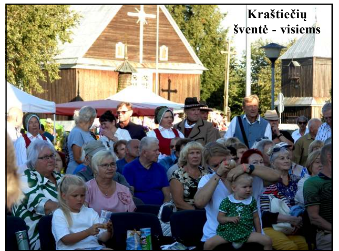
Kraštiečių šventė - visiems

Inturkės kraštas kas kartą visus būrin sukviečia per Žolinę, kuomet didžioji dalis darbų nuveikta, kuomet žaluma savo sodruma vis dar kviečia džiaugtis jau besibaigiančia vasara, kuomet pilna vasaros inturkiškių arba sugrįžtančių tėviškėn atostogauti... Tad ir šiomet čia, iš anksto sutvarkius visus pašalius, gėlynus, šeimninkiškai pasirengus sutikti svečius, surengta šventė, pavadinta skambiai - "Kartu mes neįveikiami", o skirta Lietuvos narystės NATO ir Euro-