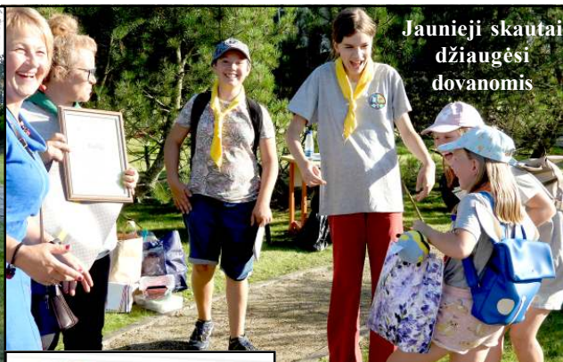
Jaunieji skautai džiaugėsi dovanomis