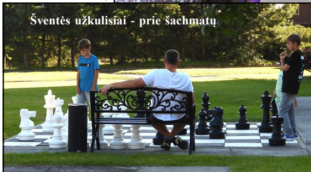
Šventės užkulisiai - prie šachmatų