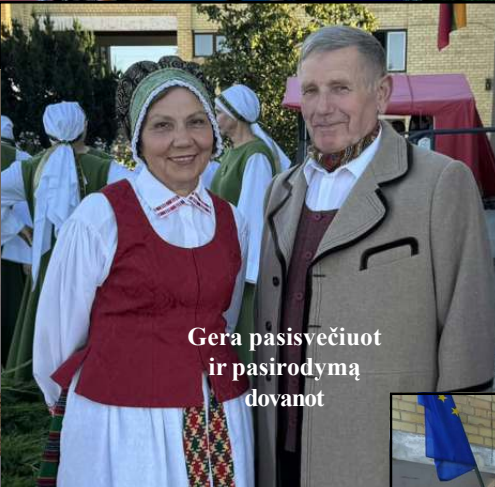
Gera pasisvečiuot ir pasirodymą dovanot