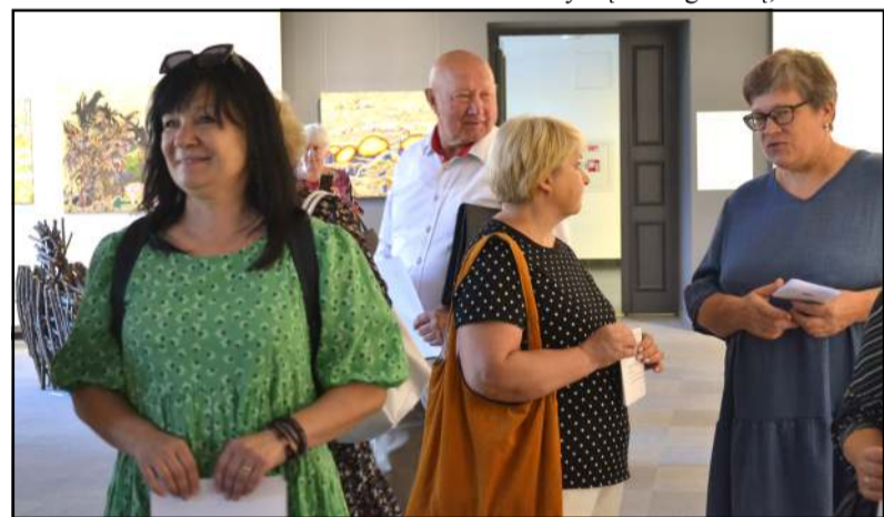
Dalykinė konferencija pradedami mokslo metai