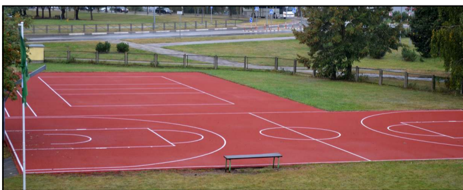
Atnaujintas vaikams skirtas aikštynas

visos dienos mokyklą. Dalis vaikų yra važinėjantys, bet ir jie būna iki maždaug 15 val. Jiems sudaryta atskira grupė, skirta patalpa, kad turėtų kur daiktus pasidėti, paruošti pamokas, nueiti į būrelius, pavalgyti. Taip visos dienos mokykla ir prasideda - dalis vaikų eina į būrelius, dalis išvežami į Menų mokyklą, dalis išeina į Sporto centrą. Ugdomoji veikla vyksta iki 17 val., o paskui dar vyksta būdėjimas, kada yra viena iš dirbančių pedagogių, o nuo 17.30 val. iki 18.00 val. - būdintysis, iki kol mokykla užrakinama 18 val. Po pamokų su vaikais dirba socialinė pedagogė, o nuo