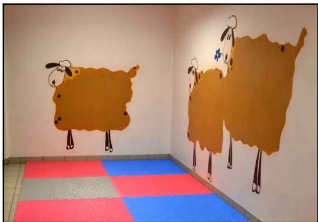
Poilsio zonose rasis ir minkštų baldų, nauji baldai buvo nupirkti mokytojų kambariu