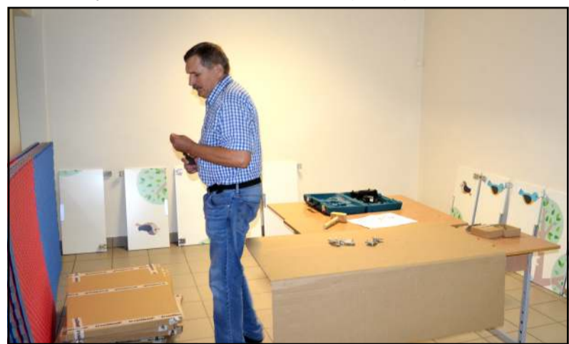
Surenkami visos dienos mokyklai skirti baldai