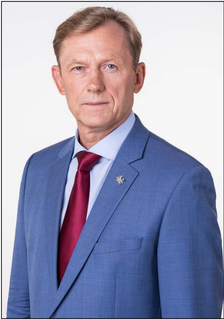
Šarūnas Birutis: „Sunkiausiais laikais tautos dvasią išsaugojo kaimas. Dabar mūsų pareiga išsaugoti jį“.

Apie kaimo realijas ir perspektyvas kalbamės su kandidatu į LR Seimą Šarūnu BIRUČIU