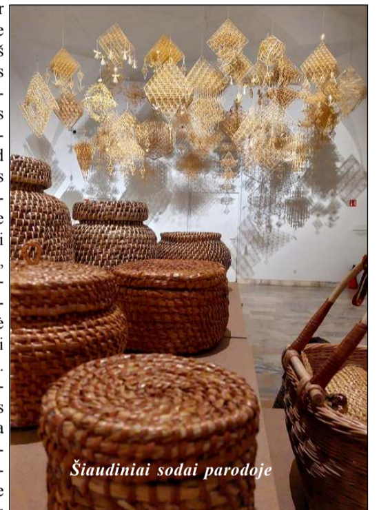
Šiauriniai sodai parodoje