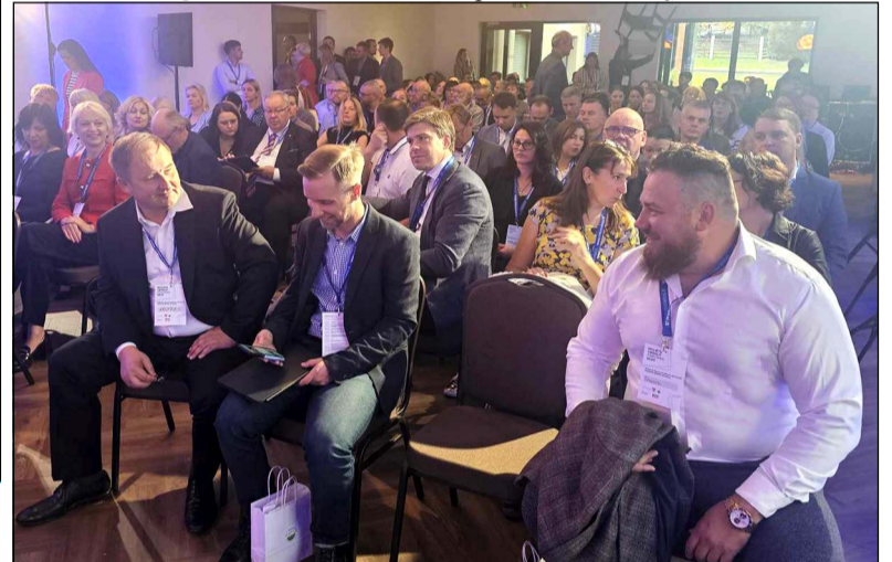
Sambūris sulaukė nemenko vietos ir iš kitur atvykusių verslininkų, savivaldybininkų bei politikų dėmesio