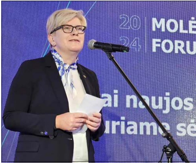
Forume pranešimą padarė ir premjerė Ingrida Šimonytė