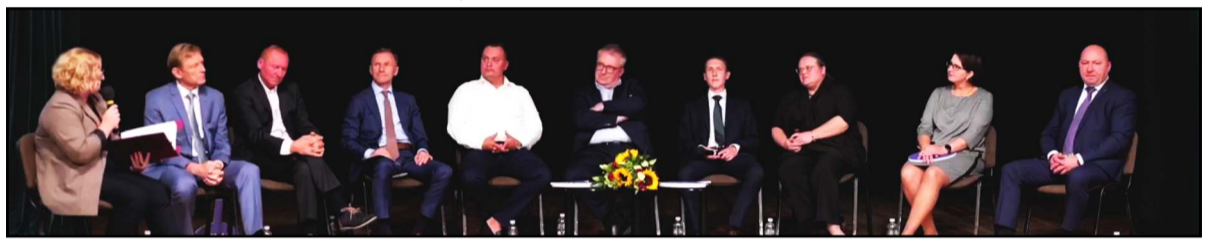
Apygardoje kandidatavusių politikų debatai buvo surengti Švenčionyse akcijos "Žinau, ką renku", esančios nešališku politikos stebėsenos tinklu, kuriame dalyvauja jauni žmonės iš įvairių Lietuvos miestų ir miestelių, iniciatyva