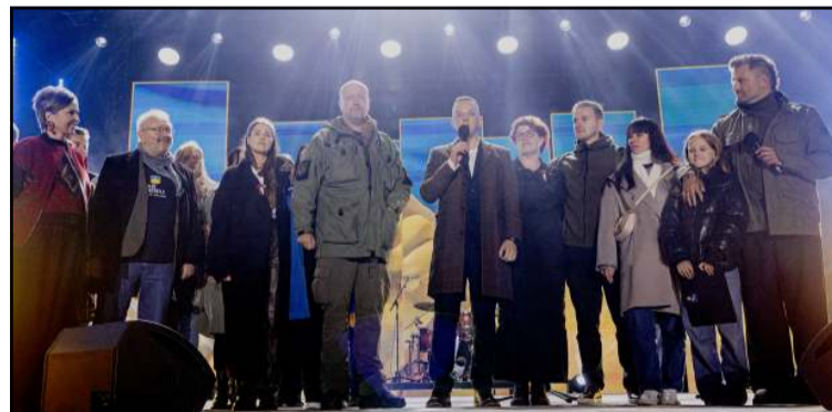
Foto - iš organizacijos dešimtmečio koncerto