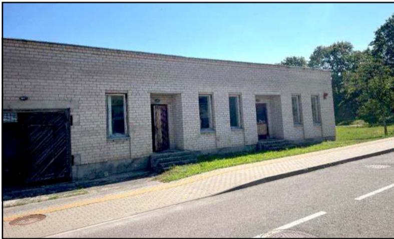
Ūkio paskirties pastatas netruks tapti laikino apnakvydinimo namais

Tarp rajono savivaldybės administracijos viešinamų projektų - naujieji: nakvynės namų steigimas Molėtuose. Jiems parinkta vieta - sveikatos įstaigų kaimynystėje, Graužinių gatvėje namo Nr. 12, kur stūkso ūkio reikmėms naudotas statinys. Tad pirmiausia bus keičiama jo paskirtis į gyvenamosios (įvairioms socialinėms grupėms), o tada atliekamas kapitalinis remontas. Statybos darbus, kurie finansuojami Europos sąjungos ir savivaldybės lėšomis, numatoma atlikti mažiau nei pusėje minėto statinio patalpų. Pakeitus jų paskirtį ir atlikus kapitalinį remontą, bus įrengti laikinieji nak-