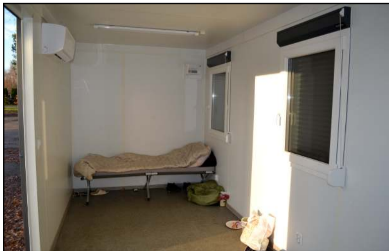
Kurį laiką orderininkai gyvendavo konteineriuose miesto priegose, tačiau šios patalpos visiškai nepritaikytos žmogui gyventi...

Molėtiškis (redakcijai prisistatė), susidūręs su labai nesmagia ir jam nesuprantama kaimynyste viename iš daugiabučių namų Vilniaus gatvėje, Molėtuose, su nuostaba klausė, kaip taip gali būti, kad asmenys, kurie kelia pavojų savo šeimose ar aplinkoje, yra tiesiog policijos atvežami ir apgyvendinami 15 parų jiems... skirtame bute, kuris yra daugiabučiame name Vilniaus gatvėje. "Kitų butų gyventojai bijo išeiti į laiptinę, nes jeigu žmogus kėlė pavojų savo aplinkoje, tai kas garantuos, kad jie neužsipuls kitų butų gyventojų, - kalbėjo molėtiškis, dar pridurdamas, kad šie asmenys naudojami bendra virtuve, san. mazgu... - Ten jau nieko palikti nebegalima, o,