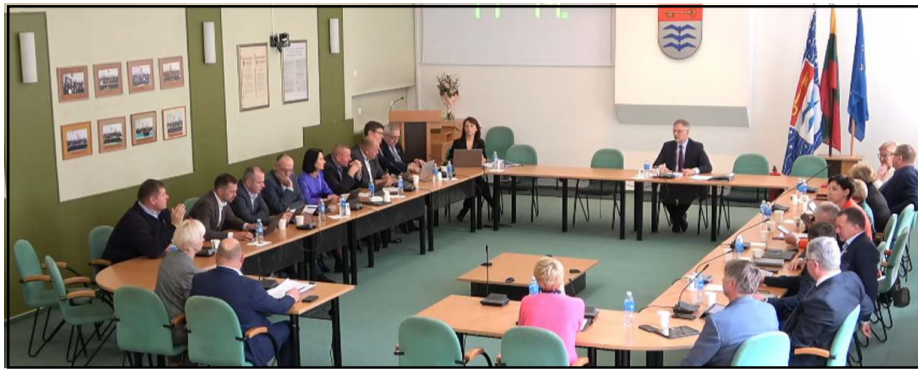
Tarybos nariai turi pasirinkti formą, kaip atsiskaitys už savo darbą rinkėjams - mokamas ne toks jau menkas atlygis turi ir įpareigojimų