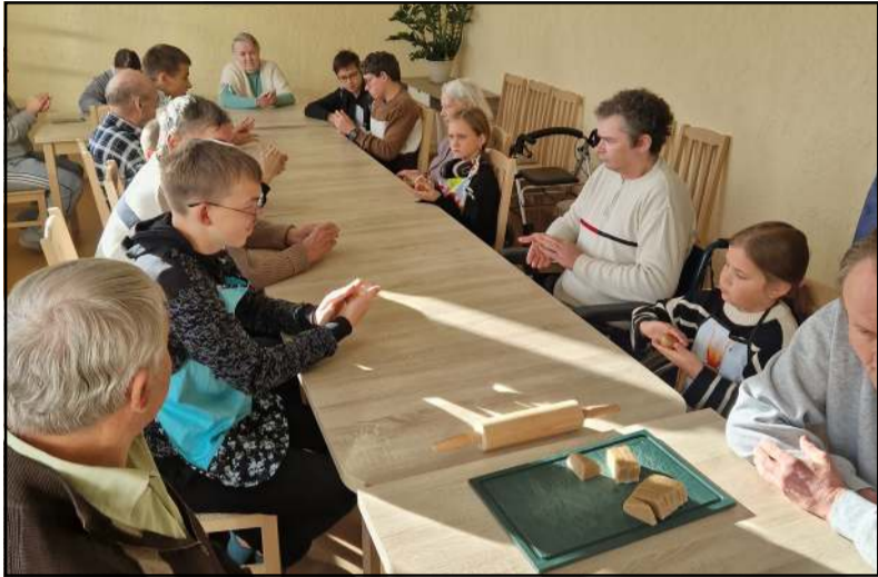
VŠĮ "Kaimynystės namuose" kartų bendrystė

Molėtų paslaugų šeimos centro globos centro skyrius spalio pabaigoje suorganizavo šeimose globojamųjų vaikų dienos stovyklą. VŠĮ