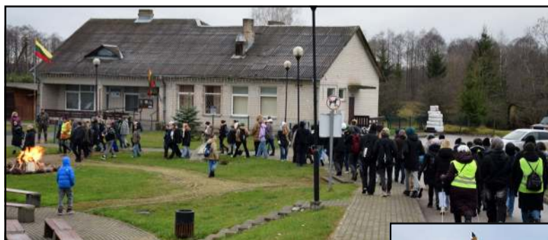
Tradiciškai šventėje - gausus sambūris