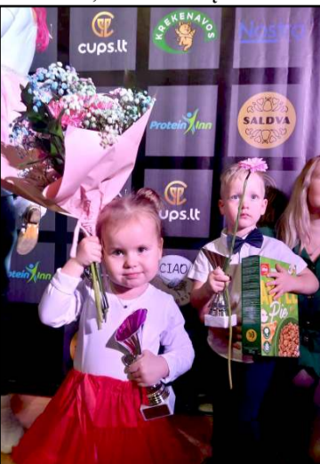
Patys mažiausieji buvo verti visų apdovanojimų - už drąsą