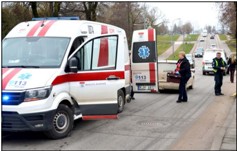
Ne pėsčiųjų perėjoje bandžiusi pereiti gatvę Molėtų miesto gyventoja buvo partrenkta automobilio "VW Golf"

kurį vairavo galimai neblaivus vairuotojas. Atvykus pareigūnams, automobilis rastas kelkraštyje, o jį vairavusi blaivi moteris sakė, kad nesuvaldžiusi automobilio posūkyje ji nuvažiuo nuo kelio, o automobilį, padedant artimiesiems, ištraukus, rytojaus dieną dėl jo transportavimo kviesta techninė pagalba.